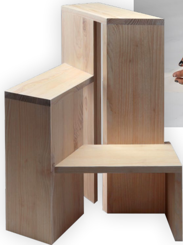
MÖBEL DOMAGOJ MARSICEK

Entdecke unter den rund 250 Designlabels 100 neue Aussteller:innen, die zum ersten Mal dabei sind und individuelle Möbel, Wohnaccessoires, Mode und Schmuck zeigen. Du triffst die Macher:innen des Designprodukts deines Herzens persönlich.