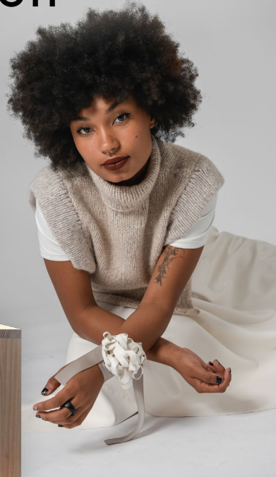
MODE FEE HEARTFELT