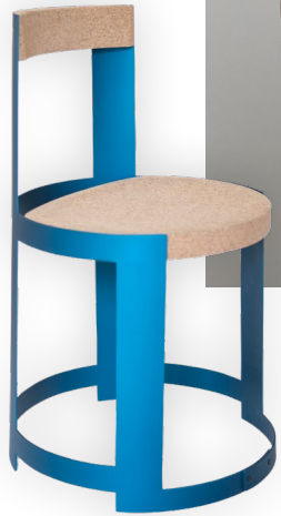
STUHL CHRISTOPH STEIGER STUDIO

Entdecke unter den über 130 Designlabels 50 neue Aussteller:innen, die zum ersten Mal dabei sind und individuelle Möbel, Wohnaccessoires, Mode und Schmuck zeigen.