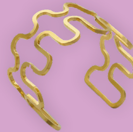
ARMREIF FELIX DOLL