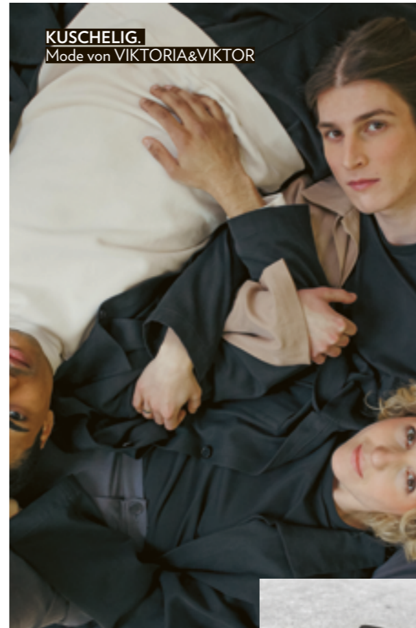
KUSCHELIG. Mode von VIKTORIA&VIKTOR