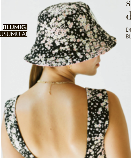
BLUMIG. Design by SUSUMU AI

Bei 150 Aussteller:innen aus 12 Nationen gab es jedenfalls jede Menge zu bestaunen und zu entdecken. Mit der Sonderschau CZECH TRADE lag in diesem Jahr ein besonderer Fokus auf modernem Design aus Tschechien. Unter den 20 Aussteller:innen befand sich auch das Label Polstrin, das traditionelle tschechische Handwerkskunst mit zeitgemäßem Design verbindet und bereits mehrfach ausgezeichnet wurde. Aus österreichischer Sicht überzeugte un-