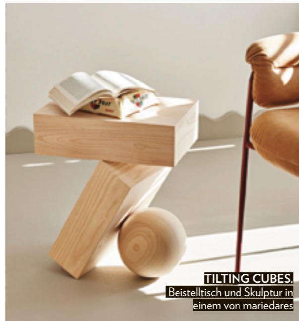
TILTING CUBES. Beistelltisch und Skulptur in einem von mariedares