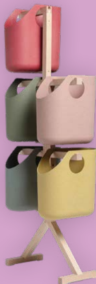
MÖBEL PUZZLE DESIGN