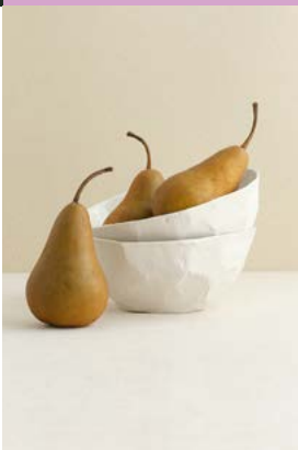
SCHALE ARAI CERAMIC

Für qualitatives, ehrliches Design am Puls der Zeit stehen alle Designlabels auf der BLICKFANG. Du unterstützt sie mit dem Kauf ihrer mit Herzblut gefertigten Produkte und Kollektionen und sorgst ganz nebenbei für mehr Vielfalt in der Branche. Inspirierende Begegnungen und spannende Geschichten inklusive.