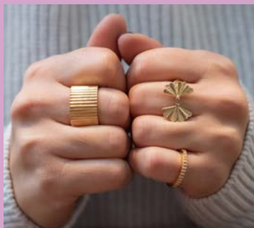
SCHMUCK V DESIGNLAB