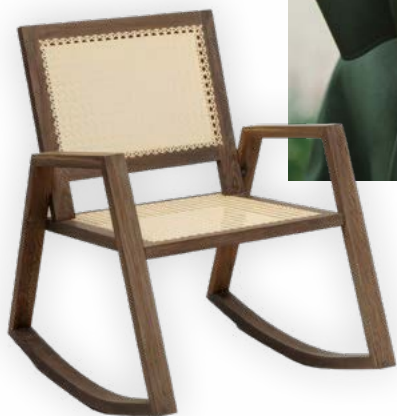
STUHL D ART DESIGN

Entdecke unter den über 180 Designlabels 90 neue Aussteller:innen, die zum ersten Mal dabei sind und individuelle Möbel, Wohnaccessoires, Mode und Schmuck zeigen.