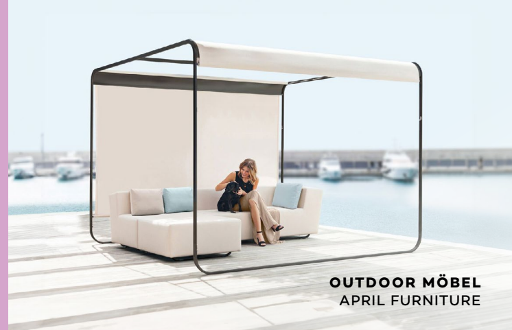
OUTDOOR MÖBEL APRIL FURNITURE