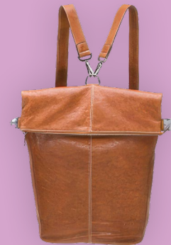
RUCKSACK EDITION NOTO