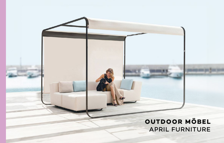
OUTDOOR MÖBEL APRIL FURNITURE