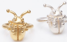
RINGE MONIR JEWELLERY

Die Welt zeigt sich in ihrer ganzen Vielfalt – genau wie unsere Designlabels. Hier trifft österreichisches Design auf kreative Schätze aus 15 weiteren Ländern, die zusammen eine bunte Palette an einzigartigen Stilen und Ideen präsentieren. Unter ihnen erwarten dich rund 50 neue Labels, die voller Vorfreude sind, dich persönlich kennenzulernen und mit ihren innovativen Kreationen zu begeistern. Tauche ein in diese inspirierende Designwelt und entdecke deinen ganz persönlichen Favoriten!