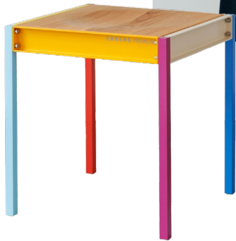
HOCKER EBBERS PREMIUM

Auch in diesem Jahr lädt dich die BLICKFANG Wien wieder zu einzigartigen Designentdeckungen ein: Freue dich auf die Sonderschau „Czech Design“, den Studierendenwettbewerb, spannende Präsentationen von Design-Hochschulen sowie die Japan Design Corner. Hier kannst du innovative Ideen, frische Talente und internationale Kreativität hautnah erleben – eine perfekte Gelegenheit, dich von den neuesten Trends begeistern zu lassen und besondere Designstücke zu kaufen. Mehr zu diesen Highlights erfährst du hier: