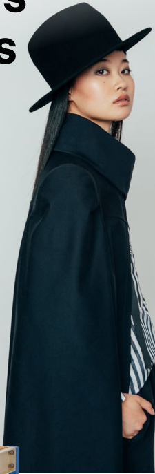
MODE CAPE DE COEUR

BESONDERES DESIGN, DAS DU IN WIEN NUR HIER FINDEST